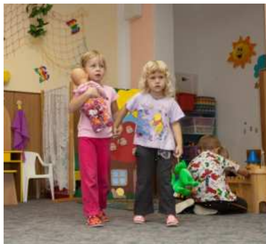
... hrajeme si