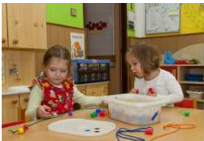
... navlékáme korálky ... s panenkou...