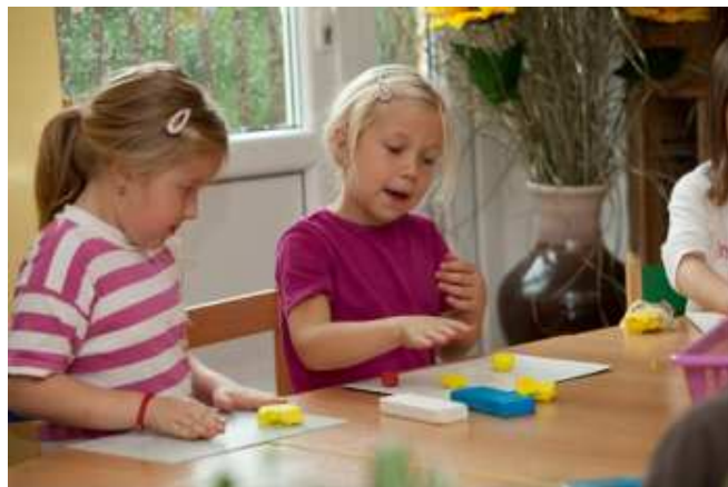
... modelujeme ...