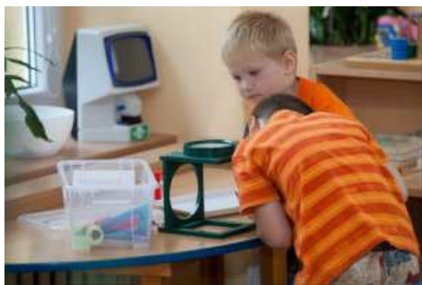
... pozorujeme pod lupou ...